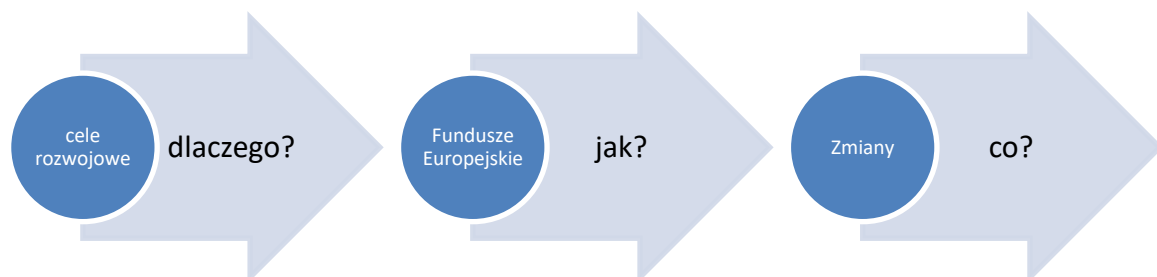
Rys. 2. Schemat: Jak formułować przekaz na temat Funduszy Europejskich?

Kiedy przystępujemy do tworzenia przekazu o FE, powinniśmy posługiwać się schematem (rys. 2). Nie ma znaczenia to, czy są to działania informacyjne czy promocyjne i do kogo je kierujemy. Schemat jest uniwersalny.